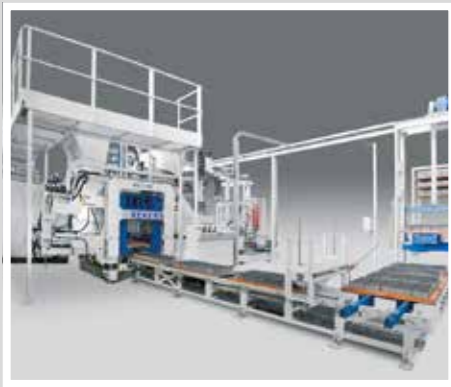
TTT Steinformmaschine Камнеформовочные машины