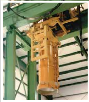
TTT Rohr-Handling Комплексные линии по производству бетонных труб