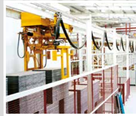
TTT Palettenhandling Транспортировка / хранение