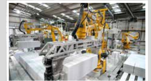
TTT Industrie-Roboter Индустриальный робот