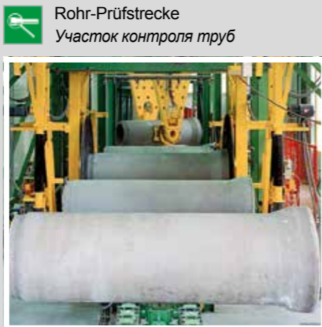
TTT Rohr-Prüfstrecke Участок контроля труб