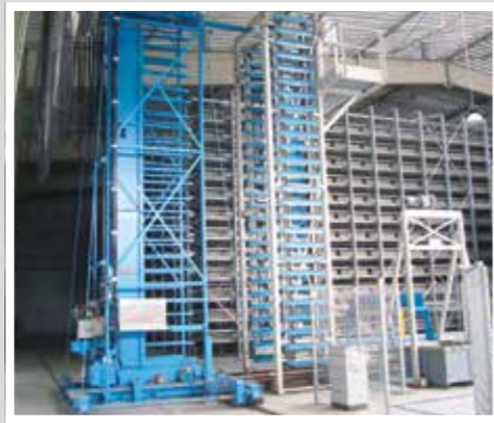
TTT Transport der Produkte auf Paletten Транспортировка изделий на поддонах