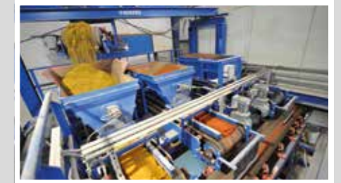
TTT Colour Blending System REKERS – Система Colour Blending