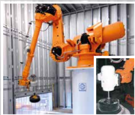
TTT Muffen-Handling Технологическая обработка производственных муфт