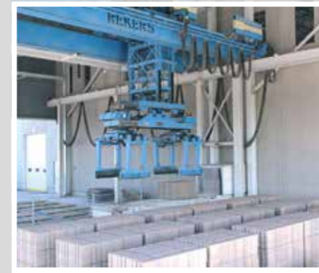
TTT Pakettransport Транспортировка пакетов изделий