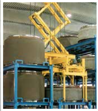
TTT Schachtring- und Schachtrohr-Handling Комплексные линии производства шахтовых колец и горловин колодцев