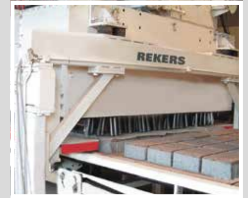
TTT In-Line Veralterung von Betonsteinen „Rekers-Steinantiker“ - старение изделий