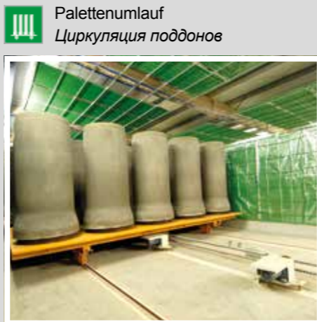
TTT Palettenumlauf Циркуляция поддонов