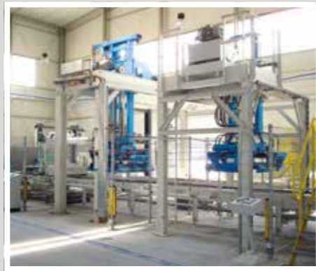
TTT Paketierung Пакетирование