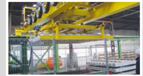
TTT Bahnschwellenproduktion Внутрипроизводственную транспортировку ж/бетонных шпал