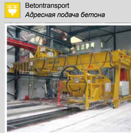
TTT Betontransport Адресная подача бетона